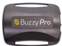
・バイブレーター 1個 ※単4アルカリ電池 2つ入