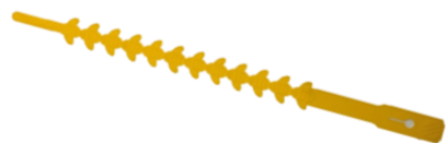
・固定バンド 2本 ・添付文書 兼 取扱説明書 1枚