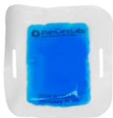
・アイスパック (冷却ジェル) 5枚