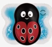
Buzzy ミニ レディバズ