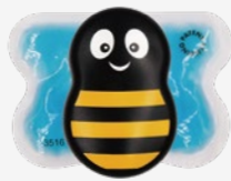
Buzzy ミニ ストライプ