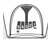
※抵抗表示器の拡大図