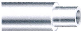
●ポンプ接続チューブの内側にもテフロン加工を施しており、薬液の吸着がありません。