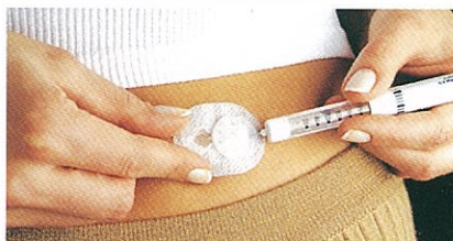
●ポンプを外してキャップセット時も一時的に薬液を注入することが可能です。